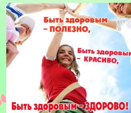
Курение, алкоголизм, наркомания